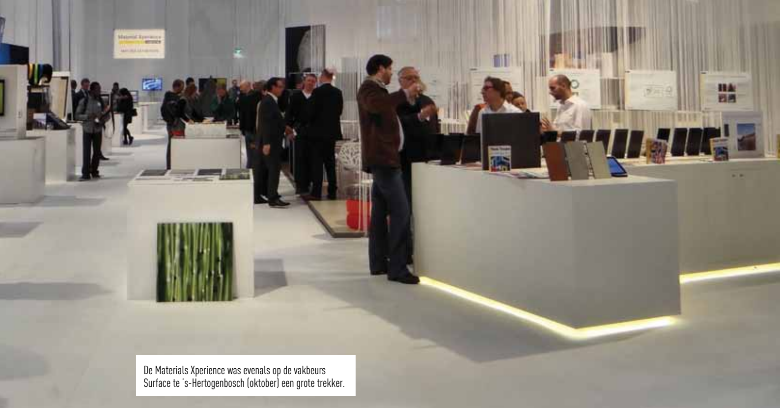
De Materials Xperience was evenals op de vakbeurs Surface te 's-Hertogenbosch (oktober) een grote trekker.