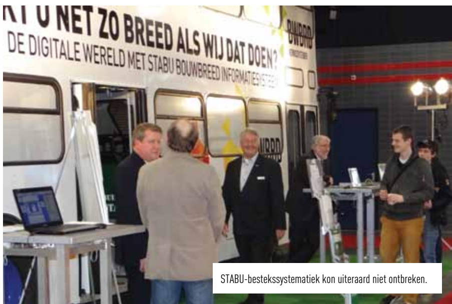
STABU-bestekssystematiek kon uiteraard niet ontbreken.

ontwerpers, architecten en andere geïnteresseerden langs de vele uitstallingen van frappante vondsten, bijzondere materiaalkeuzes en uiteraard oppervlaktetechnieken.