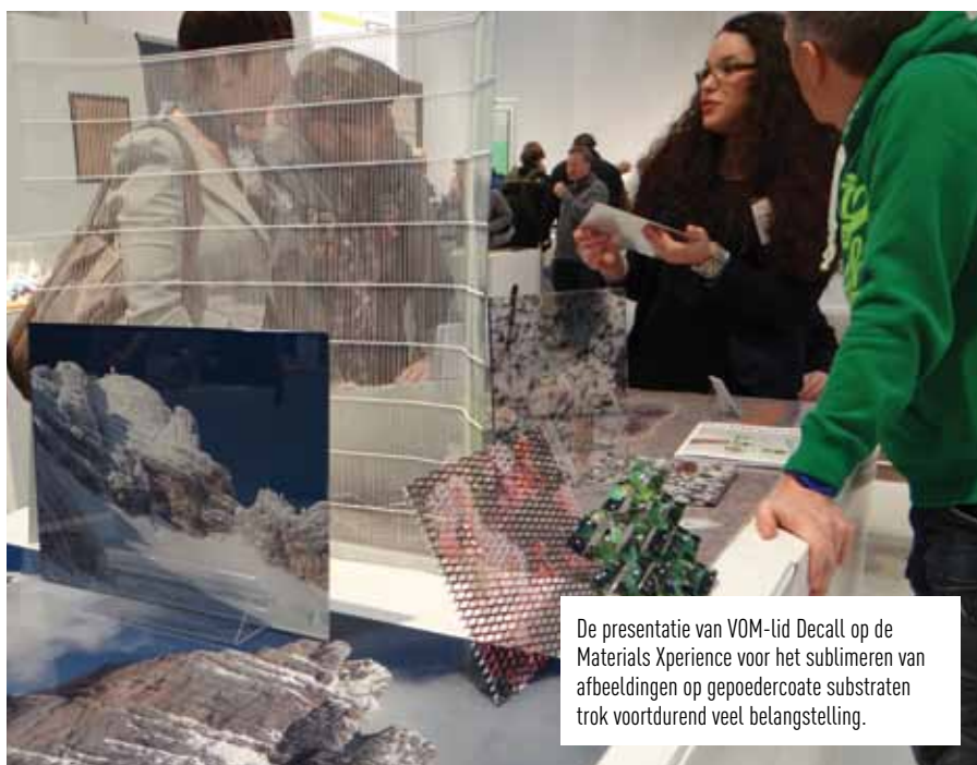
De presentatie van VOM-lid Decall op de Materials Xperience voor het sublimeren van afbeeldingen op gepoedercoate substraten trok voortdurend veel belangstelling.

uitgevoerd, maar zullen, verrassend genoeg, alle trolleys worden voorzien van dit coil-gelakte product. Het gevolg is dat ook de unieke kleuren in de laklaag zullen worden gesublimeerd. De innovaties voor de bouwbeurs zijn de tweelaags-poederlaksystemen met Qualicoat/GSB-garantie van meer dan tien of vijftien jaar, waarvan er één eigenschappen bezit die een inzet als tafelblad en/of vloerpaneel mogelijk maken. Tijdens de beurs heeft Decall de nieuwe website gelanceerd. Het bedrijf heeft zich ontwikkeld van pionier, product- en procesontwikkelaar tot innovatief specialist, adviseur en begeleider bij het tot stand brengen van nieuwe product-marktcombinaties. Maar ook voor het verwerven van kwaliteitslabels op het eindproduct en voor de toegepaste materialen spant Verdwaald zich nog altijd volop in. De leefomgeving wordt dus een stukje mooier en duurzamer dankzij deze combinatie van oppervlaktetechnieken. <