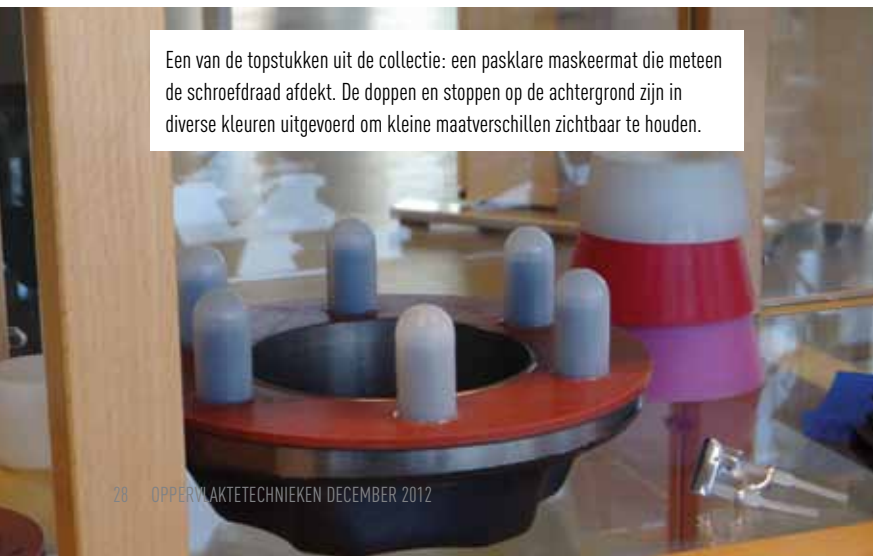
Een van de topstukken uit de collectie: een pasklare maskeermat die meteen de schroefdraad afdekt. De doppen en stoppen op de achtergrond zijn in diverse kleuren uitgevoerd om kleine maatverschillen zichtbaar te houden.

Inmiddels dringt, mede dankzij de Inspiratiekamer en het werk van de vertegenwoordigers en de ontwikkelafdeling, het besef door dat de winst van een spuitertij in de proceslogistiek zit: dus in het vinden