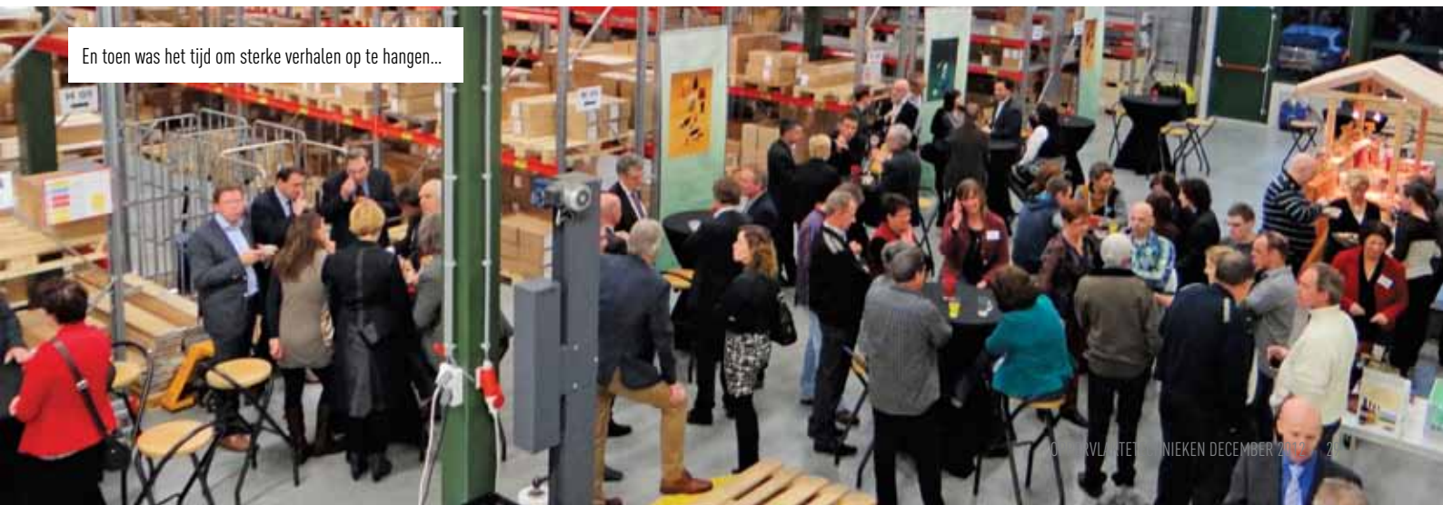
En toen was het tijd om sterke verhalen op te hangen...

Hang On nieuw adres: Songertweg 16 5961 NG Horst aan de Maas www.HangOn.co