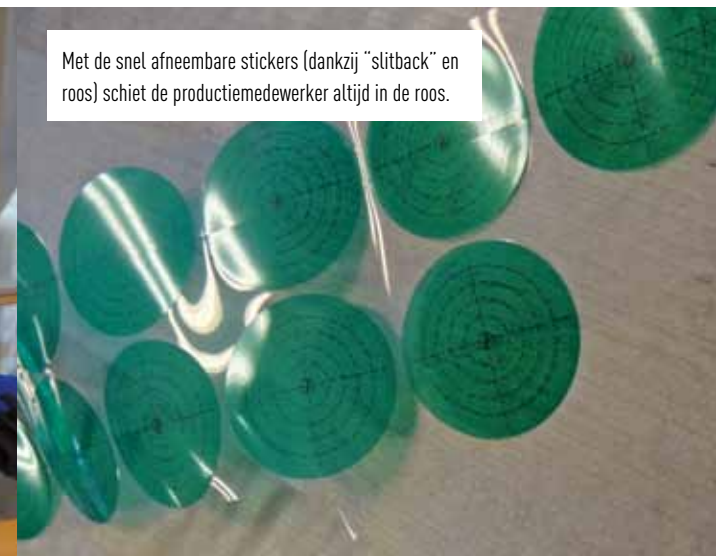
Met de snel afneembare stickers (dankzij "slitback" en roos) schiet de productiemedewerker altijd in de roos.