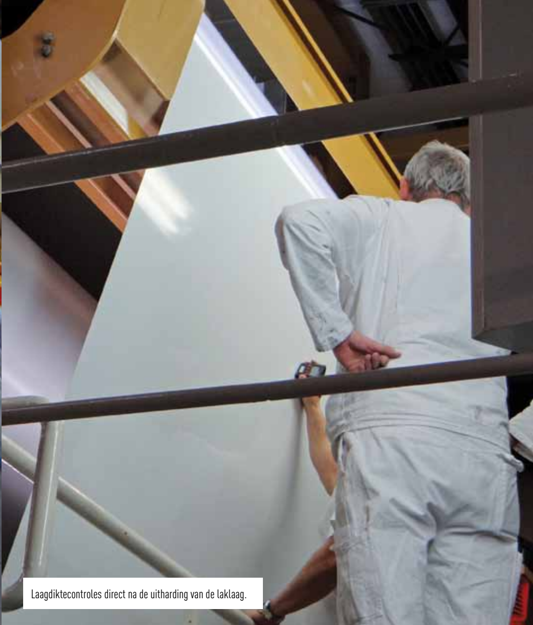
Laagdiktecontroles direct na de uitharding van de laklaag.

afzetmogelijkheden. “Wij verkopen coils aan klanten die sandwichpanelen maken. Daar worden dan vloeren van gemaakt. Het is heel aannemelijk dat u op materiaal van Euramax stapt als u met de trein reist. Ook containers, waaronder koelcontainers, vormen een enorme markt. Ambulances, paardentrailers, de binnenzijde van luxe passagiersschepen: overal zit voorgelakte plaat. Maar het is relatief onbekend.”