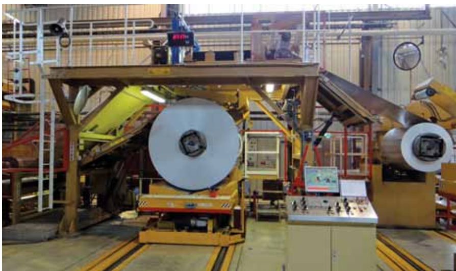
Na het coaten wordt het plaatmateriaal opgerold en uitlevergereed gemaakt.