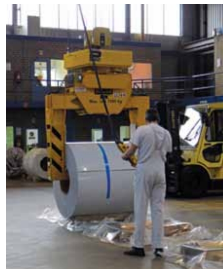
Gereed voor verzending: een halffabrikaat voor een eindproduct met uitstraling.

> woestijnstof dat overwaait." Om zijn punt te maken toonde Scheepers een dia met een zwart-witfoto van een gebouw. "Wat is een gebouw zonder kleur?" Om vervolgens dezelfde foto zijn kleur terug te geven. Inderdaad een wereld van verschil. "Voor het verschijningsbeeld kunnen wij heel veel betekenen, vandaar het motto 'colour your world with Euramax.'" Tal van referenties deden vervolgens de ronde – letterlijk ook, want Scheepers liet allerlei proefplaten rondgaan. Daarbij is het meer dan kleur en bescherming. Het Rabobank Datacenter in Best is in achttien kleuren groen opgezet en gaat als een grasmotief in de omgeving op. De Maastoren te Rotterdam loopt in 21 grijskleuren