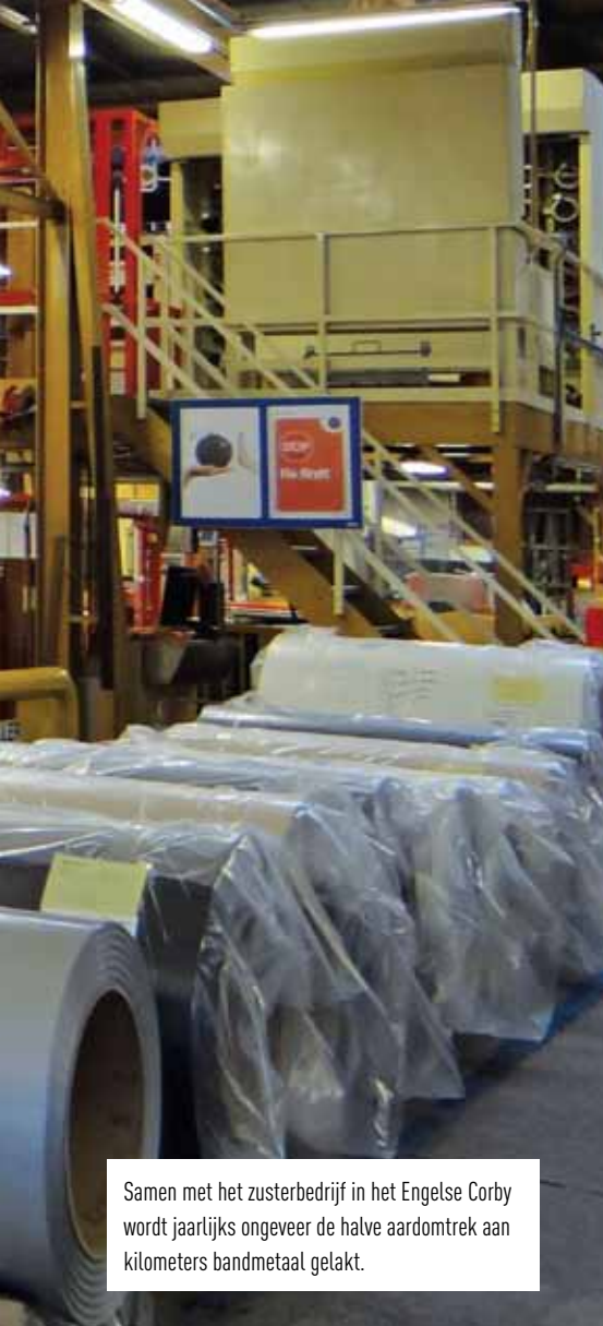
Samen met het zusterbedrijf in het Engelse Corby wordt jaarlijks ongeveer de halve aardomtrek aan kilometers bandmetaal gelakt.