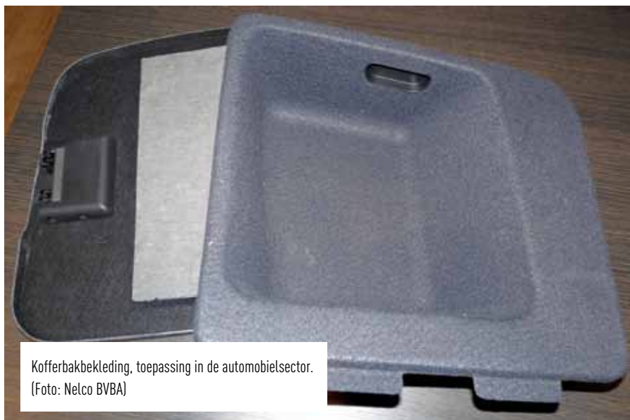
Kofferbakbekleding, toepassing in de automobielsector.

Tegenwoordig is de wetgever eenduidig: het mag niet. Vanuit de nieuwe afvalstoffenwetgeving is afvalpoeder storten of in de afvalverbranding meenemen verboden. De bedragen voor het restafval vallen vaak onder overkoepelende