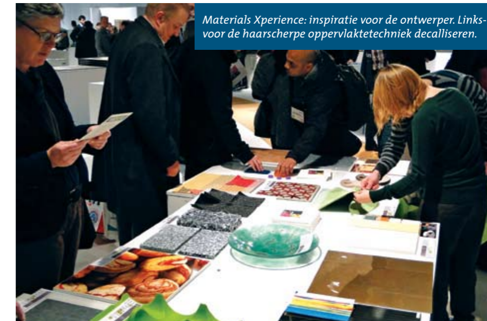
Materials Xperience: inspiratie voor de ontwerper. Linksvoor de haarscherpe oppervlaktetechniek decalliseren.