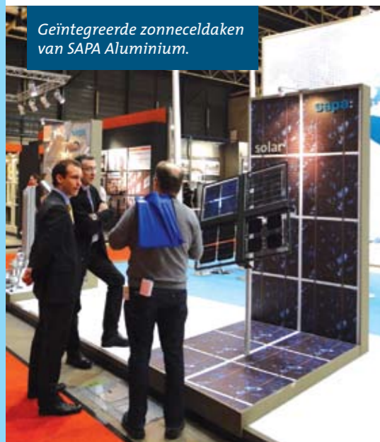
Geïntegreerde zonneceldaken van SAPA Aluminium.

De volgende Bouwbeurs zal gehouden worden van 4 tot en met 9 februari 2013. www.Bouwbeurs.nl