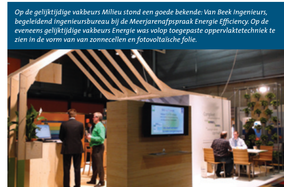
Op de gelijktijdige vakbeurs Milieu stond een goede bekende: Van Beek Ingenieurs, begeleidend ingenieursbureau bij de Meerjarenafspraken Energie Efficiency. Op de eveneens gelijktijdige vakbeurs Energie was volop toegepaste oppervlaktetechniek te zien in de vorm van van zonnecellen en fotovoltaïsche folie.

Bosklopper deze term wijselijk niet). Het beter beladen van de loopwagens spaarde eens maar liefst tweederde van de baanbezettingstijd uit. In dit geval was een overwogen uitbreidingsinvestering zelfs niet meer nodig. Een wat extreem voorbeeld, en uiteraard kunnen dergelijke analyses juist tot extra investeringen leiden in bijvoorbeeld