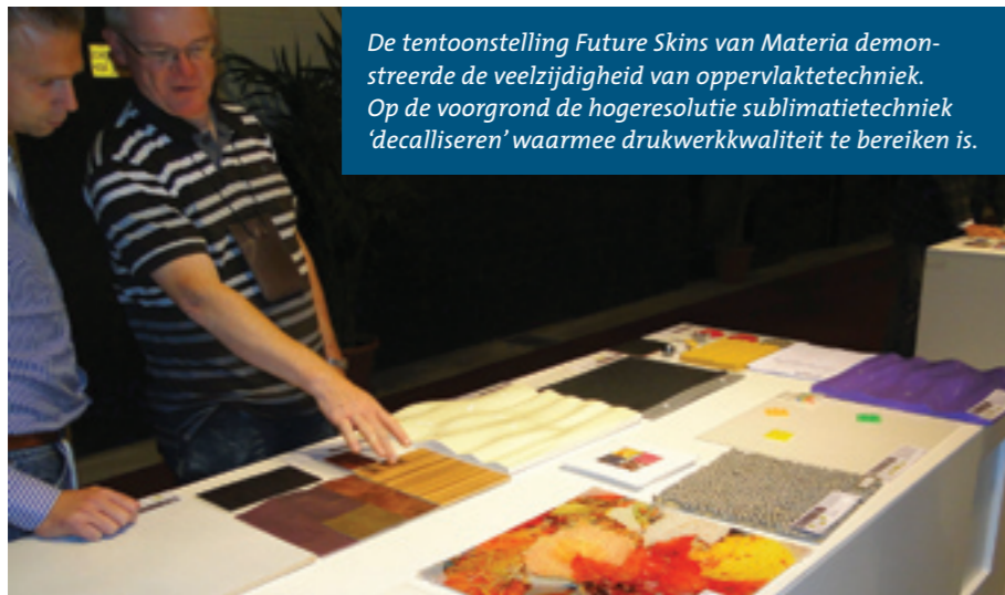
De tentoonstelling Future Skins van Materia demonstreerde de veelzijdigheid van oppervlaktetechniek. Op de voorgrond de hogeresolutie sublimatietechniek 'decalliseren' waarmee drukwerkwaliteit te bereiken is.