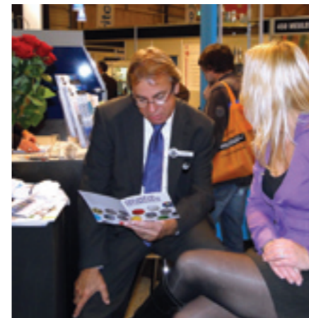
Uiteraard gingen er folders rond van de Dag van de Oppervlaktetechnieken (2 december, Zeist), die op veel belangstelling van de vakman kan rekenen.

Op de beursvloer was dus volop gelegenheid zich in twintig minuten in een onderwerp te verdiepen en meteen nuttige contacten te leggen. De opkomst wisselde sterk, mede