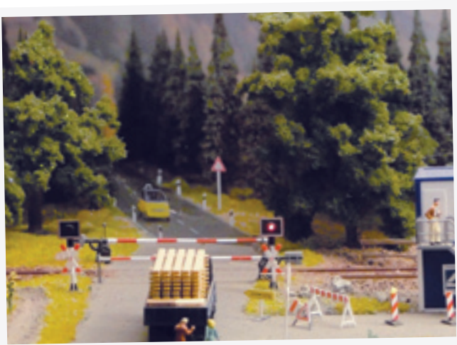
Niet het spoor bijster raken in het woud van informatie...