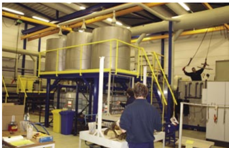
Volop activiteit op de werkvloer, want de profit moet ook blijven doorgaan natuurlijk!

bijvoorbeeld met het zoeken naar minder milieubelastende deklagen, of oppervlaktebehandelingen, zoals de keuze voor HVOF die we gemaakt hebben. Het is ten opzichte van galvanische lagen een relatief dure oplossing, maar door innovatie en efficiëntie proberen wij een slag te maken dat er een goed alternatief geboden kan worden." Belangrijk binnen het bedrijf is de watersparing. Het water wordt zodanig gemonitord op elke afdeling en het proces van de waterstanden wordt elke dag gecontroleerd, om in kaart te brengen hoe met minder water toegekomen kan worden. "CZL was één van de eersten die zo'n waterzuiveringssy-