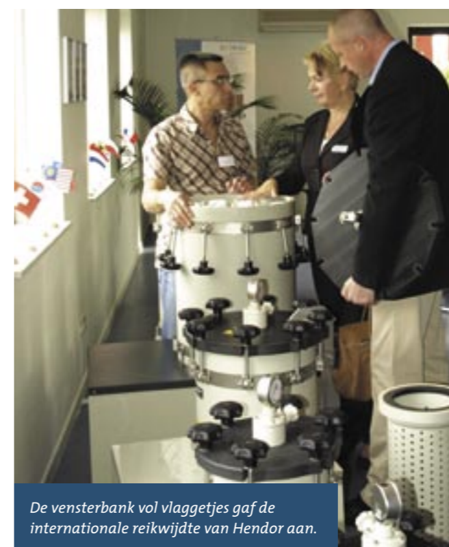
De vensterbank vol vlaggetjes gaf de internationale reikwijdte van Hendor aan.