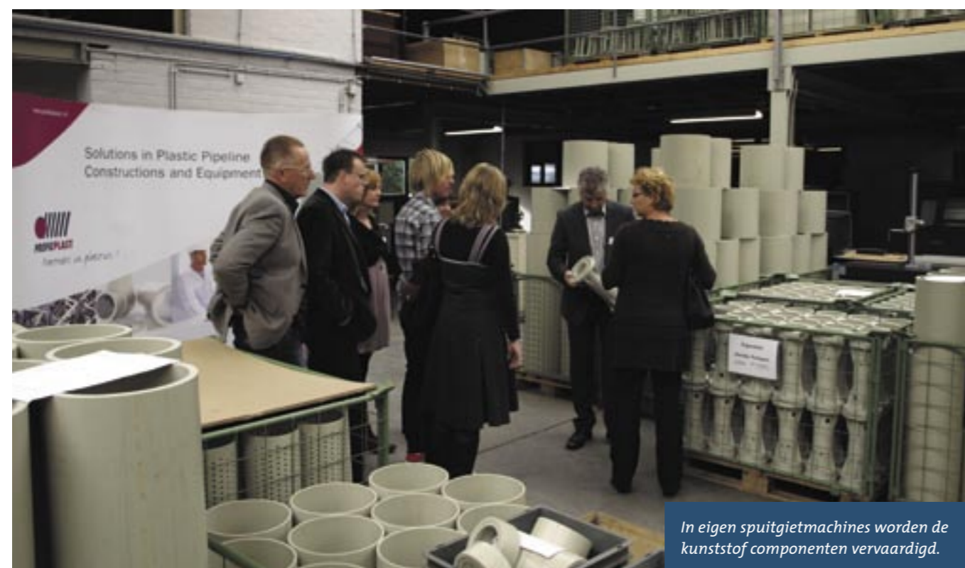
In eigen spuitgietmachines worden de kunststof componenten vervaardigd.

De rondleidingen voor de ruim honderd gasten voeren langs productie-, test- en montageafdelingen, maar ook de ontvangstruimte wordt benut om daar opgestelde producten te demonstreren. In het bedrijf werken 25 mensen, volgens verkoop-