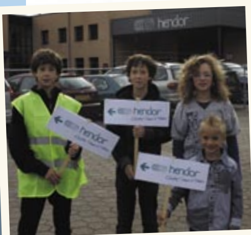
De jonge generatie wijst de weg naar de toekomst in pomp- en filtertechniek.

De rondleidingen voor de ruim honderd gasten voeren langs productie-, test- en montageafdelingen, maar ook de ontvangstruimte wordt benut om daar opgestelde producten te demonstreren. In het bedrijf werken 25 mensen, volgens verkoop-